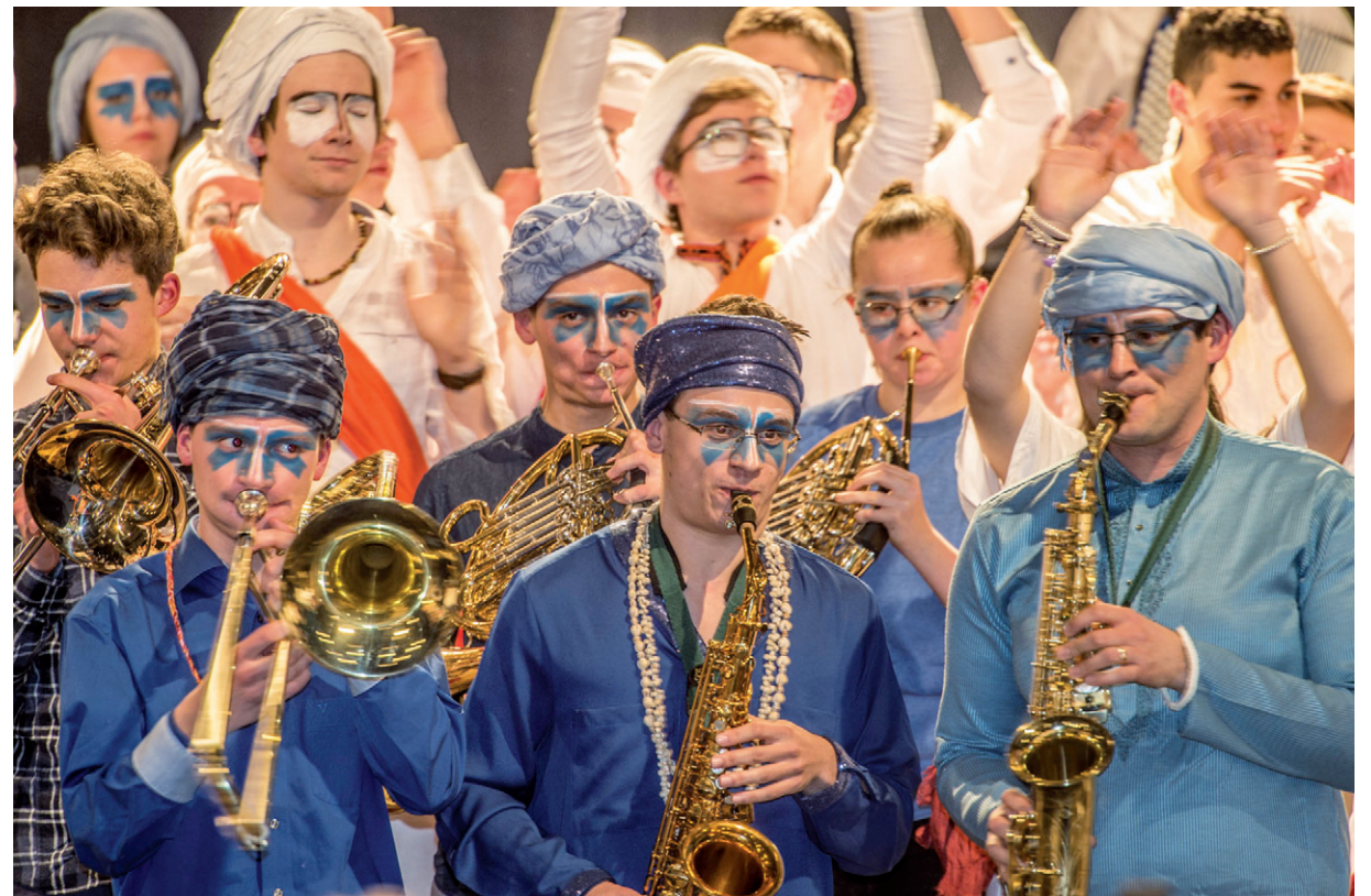
Das Konzert der Gymnasien der Grenzregion ist jedes Jahr ein Publikumsmagnet